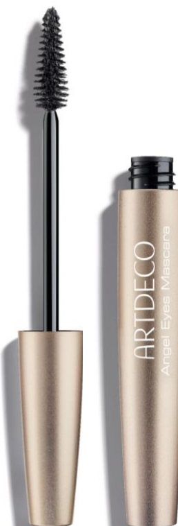
ANGEL EYES MASCARA