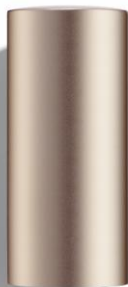
N°803P1** truly love