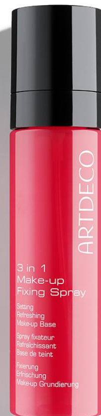
3 in 1 MAKE-UP FIXING SPRAY