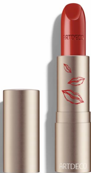
PERFECT COLOR LIPSTICK